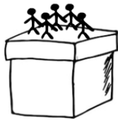
tým na bedně: đội trên thùng

Znalost cizích jazyků se nikdy neztratí! Lekce pro začátečníky: