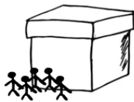
tým před bednou: đội trước thùng