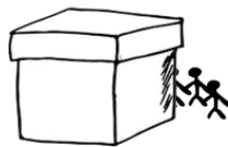
tým za bednou: đội phía sau thùng