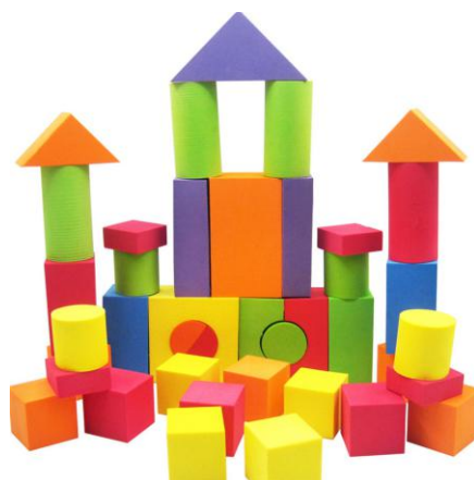
Příklad stavebnice naprosto nevhodné pro dnešní děti.

covat s něčím opravdu fyzickým, mělo by to být naopak co nej-