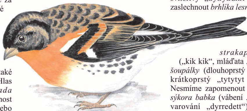
Obr.: Pěnkava jikavec ( Fringilla montifringilla )

nelze splést. Nejen pěvci mají zajímavé hlasy: u vodních ploch lze uslyšet kulíka říčního („pri-pri-pri-diji dýjydliedlí“) nebo chřástala kropenatého („huit-huit-huit“ podobající se švihání prutem nebo tokání „tryk-trek tryk-trek“). Neplést ale s chřástalem vodním (tiché,